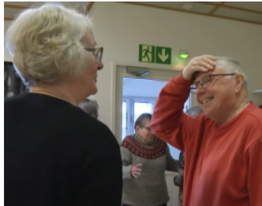
Keho ja Mieli -koulutuksessa 2023

5.11. Nestorit-juhla Jämsänkoskella Ilmoittaudu viim. 21.10 TÄSTÄ tai jarkko.utriainen@ekl.fi , puh. 050 436 3449.